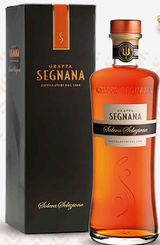
Grappa segnana SOLERA DISOLERA 40° 70cl