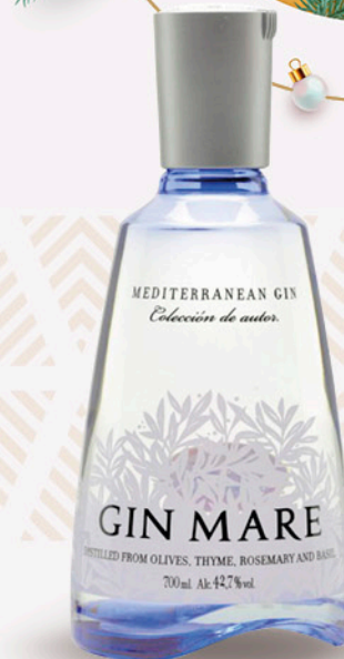
Gin MARE 70cl