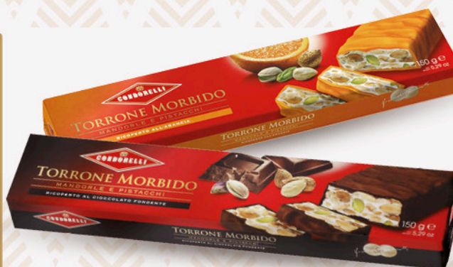
stecca di torrone CONDORELLI vari gusti 150g