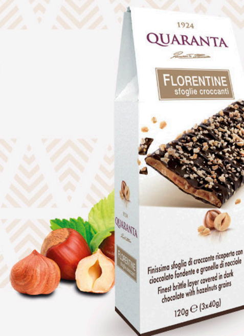
florentine sfolie croccanti QUARANTA al cioccolato fondente e granella di nocchie 120g