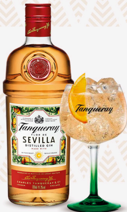
Gin sevilla TANQUERAY 70cl