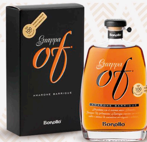
Grappa of amarone barrique BONOLLO 35cl