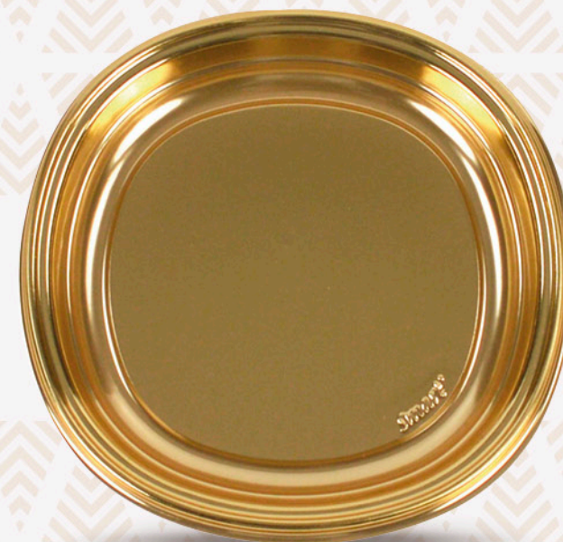
6 Piatti oro GABBIANO ø 18cm