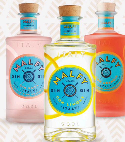
Gin MALFY original/ rosa/ limone/ arancia 70cl