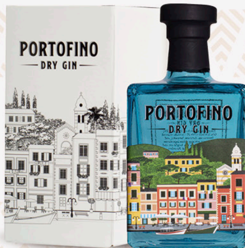
Gin PORTOFINO astuccio 50cl