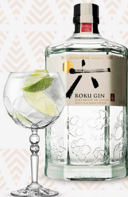
Gin giapponese ROKU 70cl