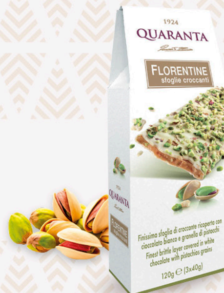
florentine sfolie croccanti al cioccolato bianco e granella di pistacchi QUARANTA 120g