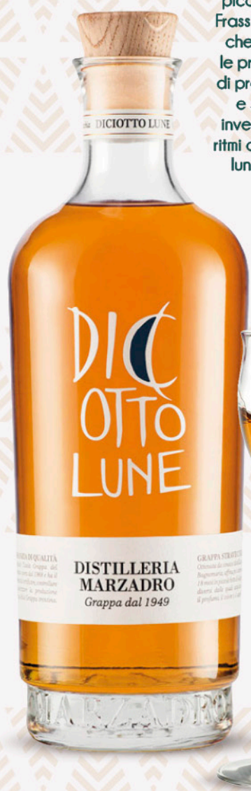
Grappa diciotto lune MARZADRO 50cl

Ottenuta dalla distillazione a Bagnomaria in alambicco discontinuo sia di vinacce rosse che di vinacce bianche. Affina in piccole botti di Ciliegio, Frassino, Rovere e Robinia che regalano ciascuna le proprie caratteristiche di profumo, aroma, colore e sapore. Il tempo di invecchiamento ricalca i ritmi della natura: di luna in luna scorrono 18 mesi