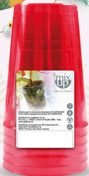
6 Bicchieri warm red GABBIANO 200cc