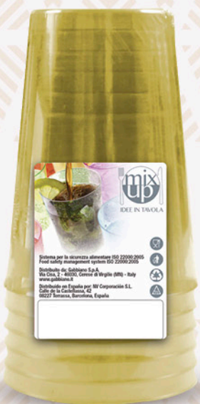
6 Bicchieri gold passion GABBIANO 200cc