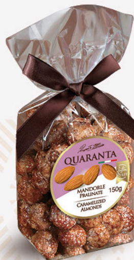
sacchetto mandorle pralinate QUARANTA 150g