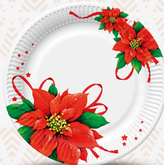
8 Piatti stella natale GABBIANO ø 18cm