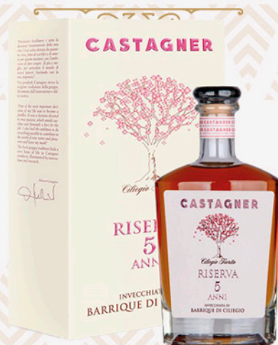
Grappa CASTAGNER ciliegio riserva a 50cl