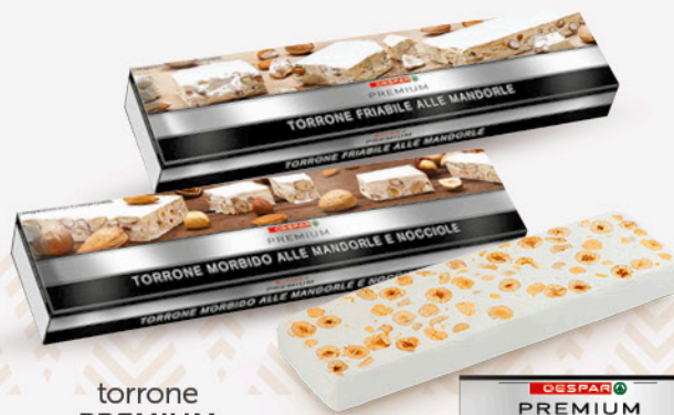
torrone PREMIUM morbido alle mandorle e nocchie/ friabile alle mandorle 90g