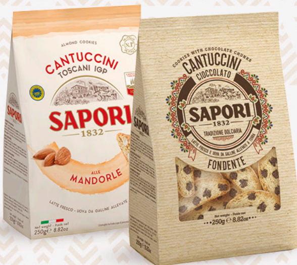
cantuccini SAPORI alla mandorla/ cioccolato 250g