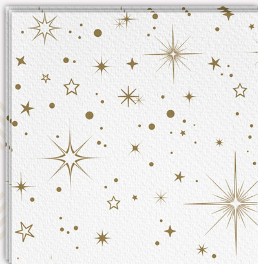
12 Tovaglioli ecotable soft GABBIANO