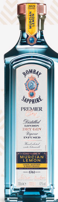
Gin premier cru BOMBAY SAPPHIRE 70cl