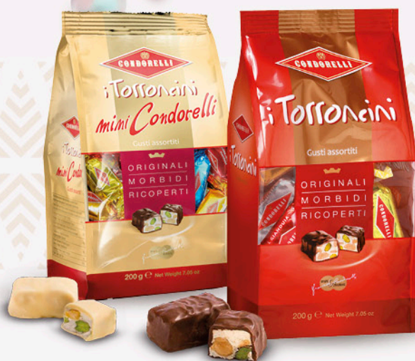
torroncini CONDORELLI classici/ mini 200g