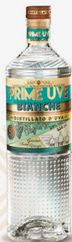
Grappa prime uve bianche MASCHIO 35cl