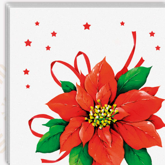
20 Tovaglioli stella natale GABBIANO 3 veli 33x33cm